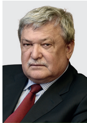
Dr. Csányi Sándor elnök-vezérigazgató

1974-ben a Pénzügyi és Számviteli Főiskolán okleveles üzempárházas, 1980-ban a Marx Károly Közgazdaságtudományi Egyetemen okleveles közgazdász diplomát szerzett, 1983-ban pedig pénzügygazdálkodás szakirányú egyetemi doktori fokozatot. 1982 óta bejegyzett könyvvizsgáló. Az egyetem után a Pénzügyminisztérium Bevételi Főigazgatóságán, illetve a Pénzügyminisztérium Titkárságán dolgozott, majd 1983-tól 1986-ig osztályvezető volt a Mezőgazdasági és Élelmiszeripari Minisztériumban. 1986-tól 1989-ig a Magyar Hitel Bank Rt.-nél főosztályvezető. A K&H Bank vezérigazgató-helyettese 1989 és 1992 között. 1992-től az OTP Bank elnök-vezérigazgatója. Alelnöke a MOL Nyrt. Igazgatóságának és a Kinai-Magyar Üzleti Tanács társelnöke. A Bonitás 2002 Zrt. tulajdonosa, amely családi holding cégként a több, mint 200 közvetlen vagy közvetett tulajdonában álló cégből álló agrár, élelmiszeripari, ingatlan és alapkezelési befektetéseit felügyeli. A Bonafarm-vállalatcsoporton és KITE Zrt.-n keresztül a KKE-régió egyik legnagyobb agrár- és élelmiszeripari befektetője – a cégcsoport éves szinten 2 milliárd euró feletti összesített árbevételrel termel 9.000 feletti alkalmazottal összesen 40.000 hektáros megművelt mezőgazdasági földterülettel. A Bonafarm-vállalatcsoport vertikálisan integrált: a mezőgazdasági cégek termelik meg az alapanyagokat az élelmiszeripari gyártónak. Jelentős ingatlan befektetéseik vannak a Gránit-Pólusban (15%)