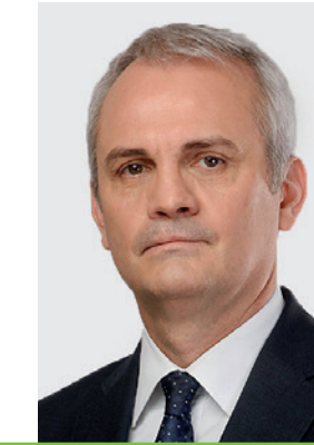
Dr. Vági Márton Gellért főtitkár Magyar Labdarúgó Szövetség

1989-ben nemzetközi közgazda szakon szerzett diplomát a Nemzetközi Kapcsolatok Egyetemén (Moszkva). Az 1990-ben alapított Wallis Holding alapító tulajdonosa, 2000-ig vezérigazgatóként irányította a csoportot. 2004-ben alapította meg a Westbay Holding Kft.-t mely társaság portfóliójába számos sikeres befektetés tartozik. 2012 óta a Magyar Sportlövők Szövetségének elnöke, 2013 óta az Európai Sportlövők Szövetség (ESC) elnökségének tagja, 2021-ben az ESC alelnökének választották. 2021. április 16-tól az OTP Bank Igazgatóságának tagja. OTP törzsrészes tulajdona 2022. december 31-én 34.800 darab volt (közvetlen és közvetett tulajdonában lévő OTP részvények darabszáma 1.118.955).